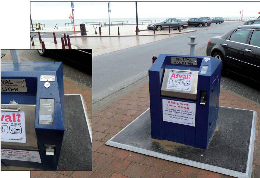
Zugangskontrolle mit Münzautomat bei einem Unterflursystem (Gemeinde Middelkerke, BE)

Engels verfügt über ein sehr modernes Zugangskontrollsystem für Unterflursammelsystemen. Das Zugangskontrollsystem besteht aus einem Kunststoffgehäuse mit einer Steuerungsplatine, die mit LEDs für die Zustandsanzeige ausgestattet ist.