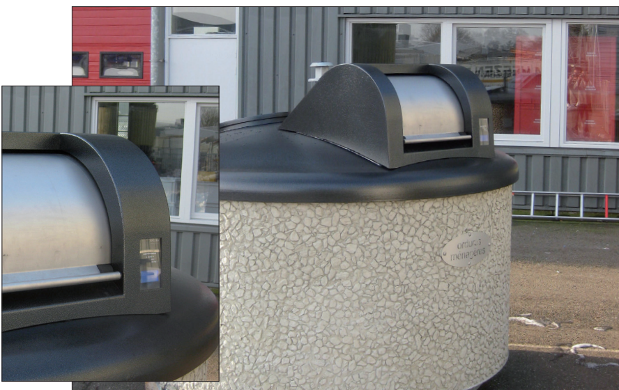
Zugangskontrolle bei einem Halbunterflursystem

Die Zugangskontrollsysteme können bei allen unseren Unterflur- und Halbunterflursammelsystemen eingebaut werden.