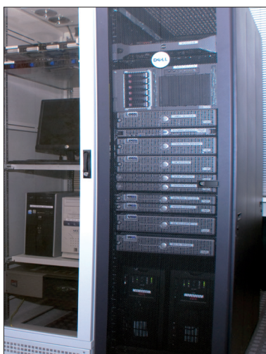
Ein eigener Serverpark mit externem Backup empfängt und speichert Ihre Daten oder leitet sie an Ihren Dienstleister weiter