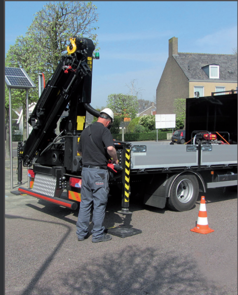
Verwaltung und Wartung