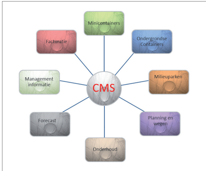
Modularer Aufbau der Containermanagement-Software