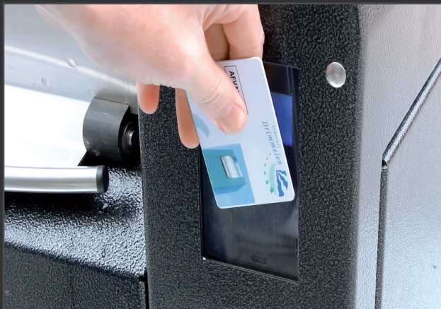
Container-Management und Servicesoftware